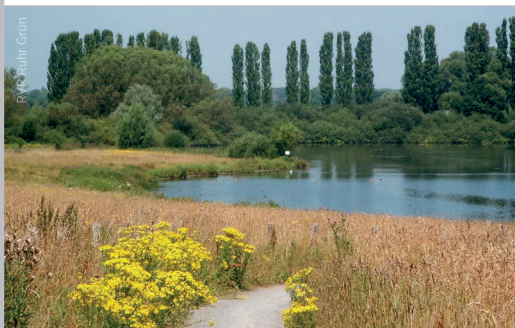
RVR Ruhr Grün