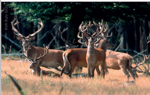
RVR Ruhr Grün