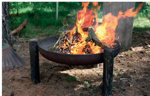
RVR Ruhr Grün

Veranstalter*in: RVR Ruhr Grün / Leitung: Anja Baum / Info: Verbindliche Anmeldung bis 2 Tage vor der Veranstaltung. Die Teilnehmerzahl ist beschränkt, bitte melden Sie sich rechtzeitig an. Telefon: (wochentags zwischen 09:00 und 12:00 Uhr) +49 (0)201 2069 717 oder E-Mail: waldwildnis@rvr.ruhr / Treffpunkt: Waldparkplatz Rangerstützpunkt, Im Höltken 9, 46286 Dorsten / Gebühren: Erwachsene 8 €